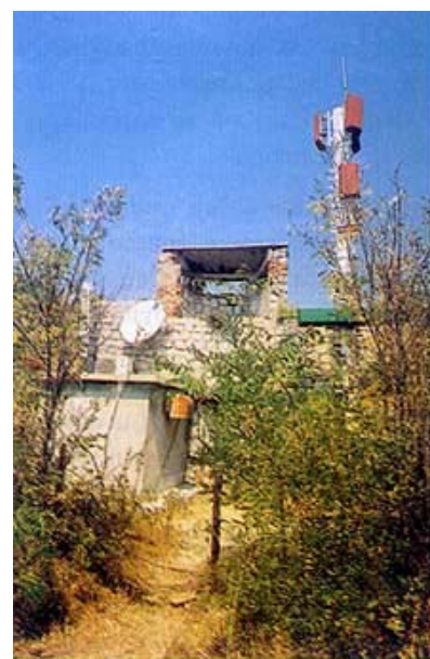
Antenski stup u kliškoj tvrđavi

Zna se da se je naselje pod utvrdom snažnije razvilo tek nakon odlaska Turaka, iako je u njemu bilo sjedište