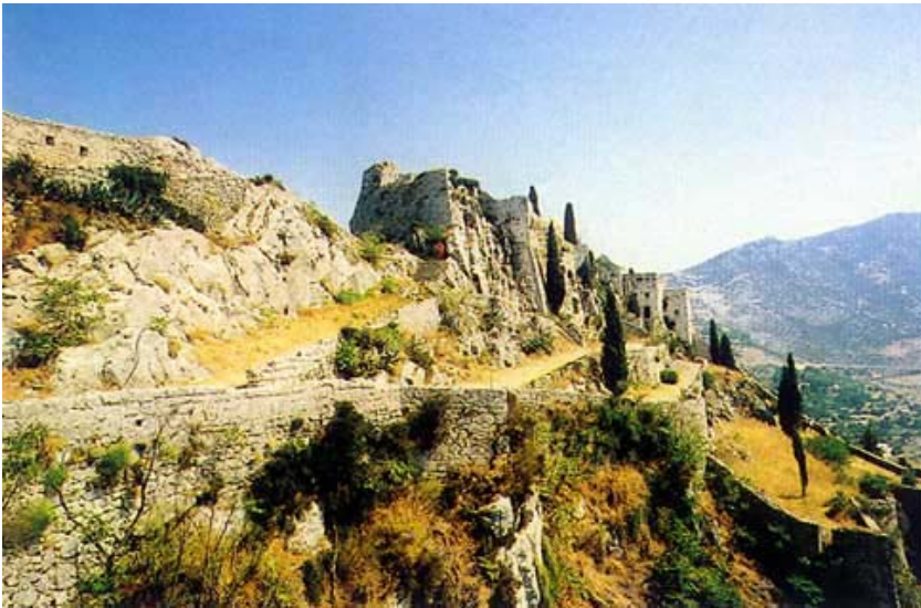
Pogled na treći i najviši dio utvrde

le Cindra u travnju 1596. uspjeli na prepad zauzeti tvrđavu. No Turci su je ponovno osvojili već krajem svibnja, porazivši pritom i slavnoga austrijskoga generala Jurja Lenkovića koji je pritekao u pomoć braniteljima.