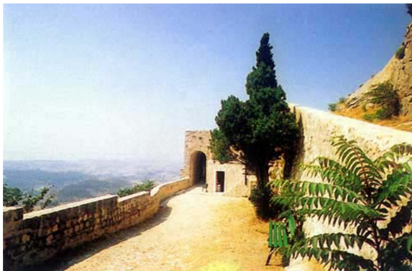
Prvi i glavni ulaz (pogled iz tvrđave)

U obrani Klisa Kružić je veliku pomoć dobivao od pape Pavla III. i od novoizabranoga hrvatskog kralja Ferdinanda Habsburgovca. Mnogi su pape često za obranu skupili znatne novčane priloge. Vladalo je najime uvjerenje da je upravo utvrda Klis glavna obrana Zapada te da bi njezinim zauzimanjem Turcima bio otvoren put prema Italiji i dalje. Bilo kako bilo, pad Klisa i pogibiju Petra Kružića i Turci su slavili kao svoju veliku pobjedu, a od tog dana točno 111 godina rijeka je Jadro granica između turskog Klisa (Kliškog sandžaka) i mletačkog Splita.