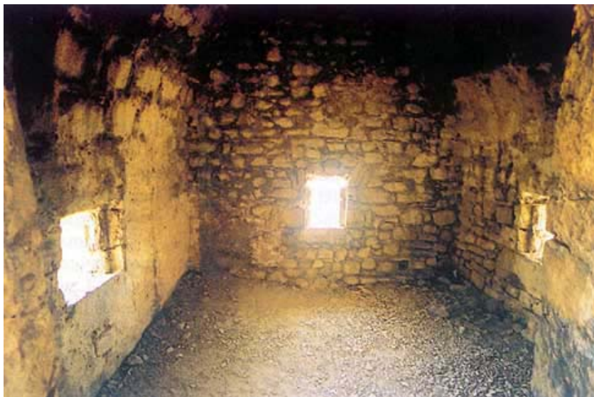
Unutrašnjost providurova stana ili kneževa kuće

zapadnoj su se strani nalazila vrata kroz koja se jedino moglo ući u utvrdu. S jugozapadne strane utvrde i ispod nje pružalo se kliško podgrađe (borgo, suburbium), opasano dvostrukim zidinama sa 100 do 200 kuća. Slično je ali manje naselje postojalo i prema Grebenu, na zaravni zvanog Megdan. Tu su bili sagrađeni lazareti i karantene koji su se u turskim vremenima nazivali nazanama. Postojala su i prenoćišta (hanovi) za prolaznike. Oni su tu noćili i odmarali se te bili podvrgnuti izolaciji u doba epidemija. Tako su se obalni gradovi, Split u prvom redu, branili od epidemija koje su se ponekad prenosile iz Bosne. U blizini utvrde nalazilo se nekoliko izvora pitke vo-