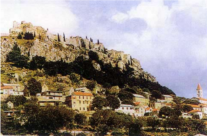
Pogled na tvrđavu i naselje Klis

hrvatsko-ugarskih kraljeva. Jedan od njih, često spominjani Bela IV., bio je na Klis sklonio svoju obitelj za tatarske opsade 1242. godine. Tada mu se u Klisu rodila i kći Margita, danas štovana kao sv. Margita Kliška. Kasnije se upravljanje Klisom često mijenja, pa su kratkotrajno zabilježeni kao njegovi vladari i bosanski i srpski kraljevi. U 13. stoljeću Klisom vladaju najmoćniji hrvatski velikaši u Dalma-