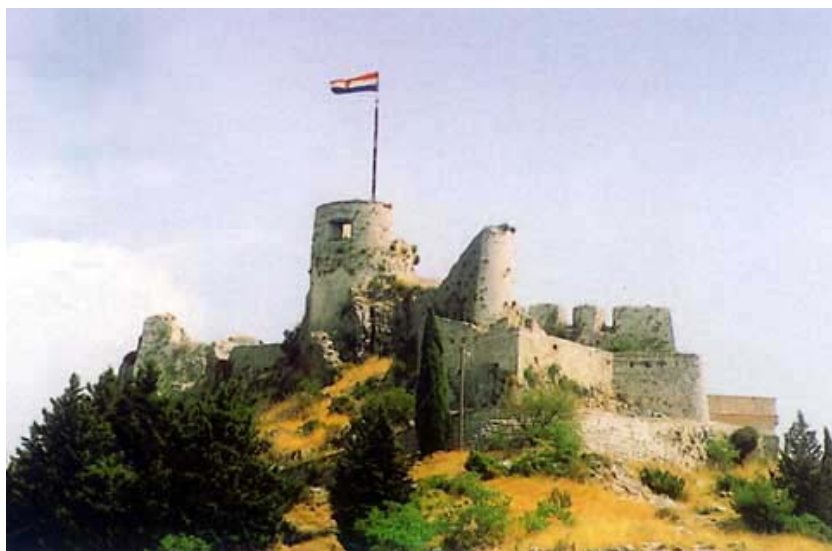
Kliška utvrda sa zastavom na kuli Oprah

Slijedi i treći ulaz koji je nastao još u srednjem vijeku. Mlečani su ga do sredine 18. stoljeća obnavljali nekoliko puta, a posljednja dogradnja izvedena je 1763. godine. Uz taj ulaz smještena je i bočna kula, građena sredinom 18. stoljeća a završena, prema poznatim podacima, 1763. godine. Slijedi spremište oružja koje je izgrađeno sredinom 17. stoljeća te stara barutana s početka 18. stoljeća. Providurov stan, nazvan i Kneževa kuća, građen je sredinom 17. stoljeća. Podignut je na temeljima najstarijih zgrada iz razdoblja hrvatskih vladara i kasnijih kliških knezova.