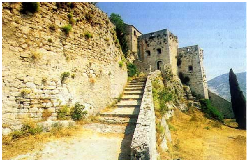
Pristup trećem ulazu

Tek je 31. ožujka 1648. godine mletačka vojska pod komandom generala Leonarda Foscola, uz brojni domaći puk, nakon desetodnevnih krvavih borbi oslobodila Klis od Turaka. To je bila najveća mletačka pobjeda u Kandijskom ratu. Klis s okolinom Mlečani su uredili kao posebno vojno-administrativno područje kojim je upravljao providur sa sjedištem upravo u Klisu. Valja reći da je sve do 1715. godine i do bitke pod Si-