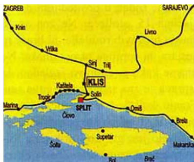
Smještaj Klisa u odnosu na Split i zaleđe

Tvrđava Klis pripada najistaknutijim utvrdama na hrvatskom tlu, a u prošlosti je imala izuzetnu vrijednost zbog važnoga strateškog i obrambenog položaja. Tvrđava i naselje smješteno ispod nje smješteni su na prijevoju između Mosora i Kozjaka, 9 km sjeveroistočno od Splita, uz staru cestu Split-Sinj. Zemljopisni i prirodni položaj činili su utvrdu važnom ne samo za bližu okolicu, već i za cijelu srednju Dalmaciju, a posebno za Bosnu. Tvrđava je smještena na samom vrhu kamenite, strme i sa svih strana nepristupačne klisure, u tijesnom klancu što dijeli Kozjak od Mosora. Klis se nad Solinom i Splitom uzdiže poput čuvara i s Klisa se još otvara pogled na Kaštela i Trogir, na otoke Čiovo, Šoltu i Brač te na udaljenije otoke kao što su Hvar i Vis. Tko je god je iz unutrašnjosti srednje Dalmacije i iz Bosne htio doći na more, morao je proći ispod Klisa. To isto vrijedilo je i za onoga tko je s mora htio krenuti u Bosnu. Postojao je samo jedan put i on je vodio uskim kliškim grlom. Klis su bila vrata koja vode iz Bosne u Primorje, a gospodar Klisa držao je njihove ključeve. Možda upravo zato i neki tvrde da naziv Klis potječe od latinskog clavis (ključ). No bilo kako bilo nerijetko je i šačica ljudi u ovoj tvrđavi znala spriječiti prolaz i oveličim vojskama.