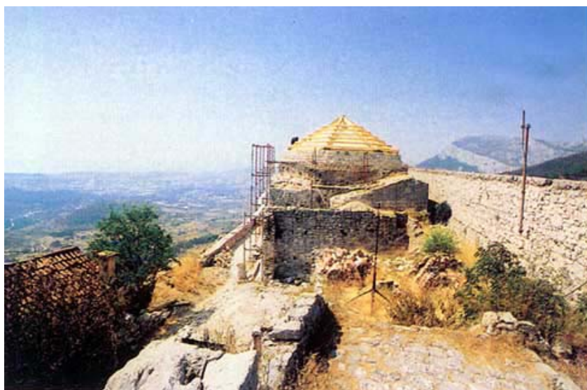
Dio tvrđave s crkvom Sv. Vida

Kliškog sandžaka. Danas općina Klis uz glavno obuhvaća sljedeća naselja: Brštanovo, Dugobabe, Konjsko, Korušice, Nisko, Prugovo, Veliki Bročanac i Vučevicu. U samom mjestu nalazi se turska česma, a u župnoj crkvi Uznesenja Blažene Djevice Marije postoje freske V. Paraća. Stječe se dojam da je danas Klis ipak poznatiji po janjetini koja se nudi u brojnim usputnim gostionicama, negoli po svojoj tvrđavi i njezinoj slavnoj prošlosti.