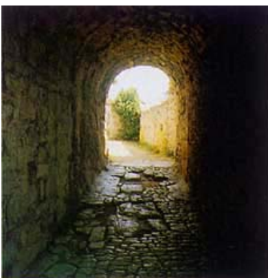
Pogled kroz treći ulaz

njem bilo pljačkaških sukoba i povremenih sukoba s turskim četama. Tvrđava je potpuno obnovljena i znatno proširena, a pod upravom Venecije ostaje sve do pada Republike 1797. godine. Tada je nakratko najprije preuzimaju Austrijanci, a zatim Francuzi. Razdoblje druge austrijske uprave započelo je 1813. godine i traje do kraja Prvog svjetskog rata 1918. godine. Austrijanci su Klisu potkraj 19. stoljeća ukinuli vojničku funkciju, a s propašću Austro-Ugarske Monarhije, zajedno s ostalim di-